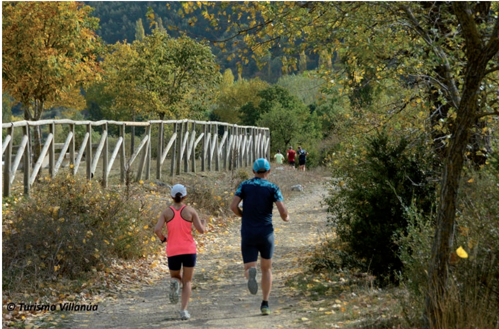
Primer cross de la temporada recorriendo un tramo del Camino de Santiago 10 de octubre de 2020. 11.00 h. Polideportivo

El Cross del Juncaral abre, tradicionalmente, el calendario de pruebas de campo a través de Aragón. Se trata de una carrera idónea para familias y corredores que se estén iniciando en el mundo del running. La prueba ofrece dos recorridos, de 11 y 5,5 Km, que discurren por senderos y pistas, de diferentes tipología, tierra, piedra o hierba, sin pisar en ningún momento el asfalto, y es prácticamente llano, siendo un trazado rápido para los especialistas. La línea de salida y meta se ubica en el polideportivo, el itinerario se adentra en el paseo y el bosque de El Juncaral y regresa a través del Camino de Santiago. El paisaje otoñal que Villanúa presenta en esta época y el recorrido por un tramo de la ruta jacobea son dos de los grandes atractivos que hacen del Cross del Juncaral una prueba única, con atractivos para principiantes y especialistas. Carrera organizada por Turismo Villanúa y el Ayuntamiento de Villanúa.