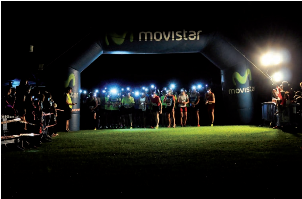
Carrera nocturna a la luz de la luna llena 1 de agosto de 2020. 23.00 h. Ecoparque El Juncaral

La Nocturna Full Moon de Villanúa es una atractiva carrera que se realiza a la luz de la luna llena de agosto. El recorrido de 5 Km. transcurre por el interior del bosque El Juncaral, que cobra un nuevo aspecto, casi onírico, para los corredores al verlo iluminado únicamente por el brillo de la luna y la luz del frontal que llevan. La Full Moon de Villanúa comienza y termina en el Ecoparque El Juncaral, con un itinerario prácticamente llano, pero de zonas mixtas, con tramos de tierra y piedras. El prueba cuenta con un gran ambiente, destaca por la belleza del paisaje por que el se desarrolla, siendo ideal para celebrar el comienzo del mes más vacacional. Es una carrera para atletas, federados o no, a partir de 18 años, organizada por Turismo Villanúa y Ayuntamiento de Villanúa.