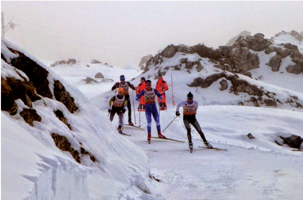
Campeonato de España de Larga Distancia de Esquí de Fondo.

Organizado en el Circuito de Esquí Nórdico de Candanchú, consta de carreras para fondistas desde la más temprana edad, hasta los más veteranos. El mismo día se organiza el Campeonato de España de Larga Distancia, con lo que la carrera tiene cabida para todos los practicantes del esquí de fondo.